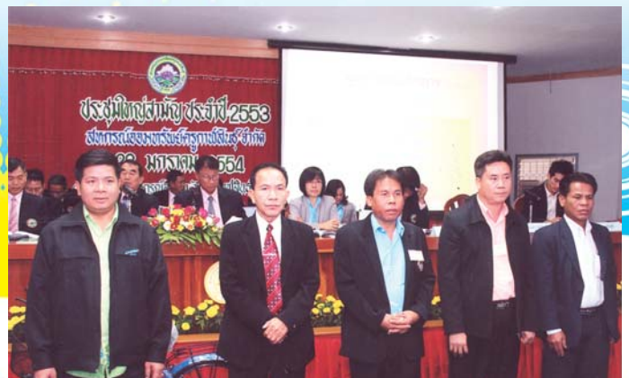
คณะกรรมการ ประจำปี 2554-2555 จำนวน 7 คน คณะผู้ตรวจสอบกิจการ ประจำปี 2554 ที่ผ่านการเลือกตั้ง จากที่ประชุมใหญ่สามัญประจำปี 2553 จำนวน 5 คน รายงานตัวต่อที่ประชุมใหญ่ เพื่อให้ที่ประชุมรับรอง